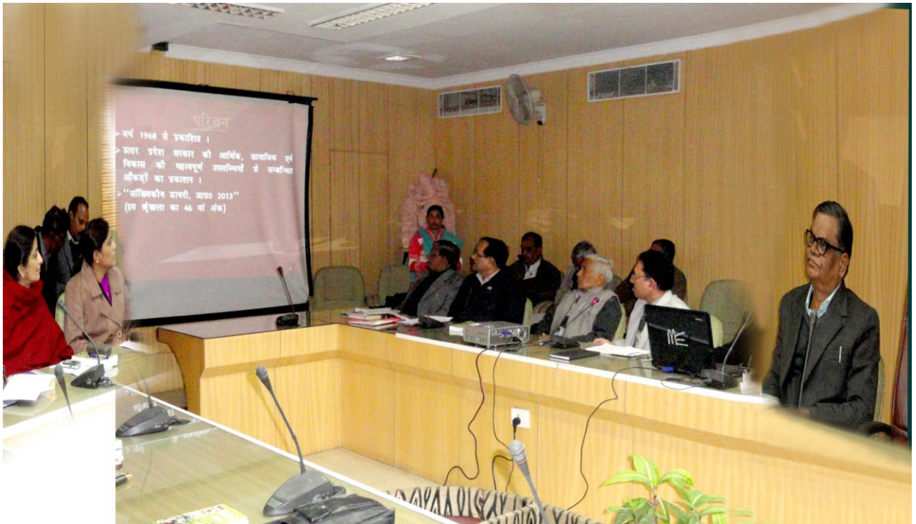
Statistical Co-ordination Committee meeting for finalization Statistical Diary 2013 held on 31.12.13 at Lucknow