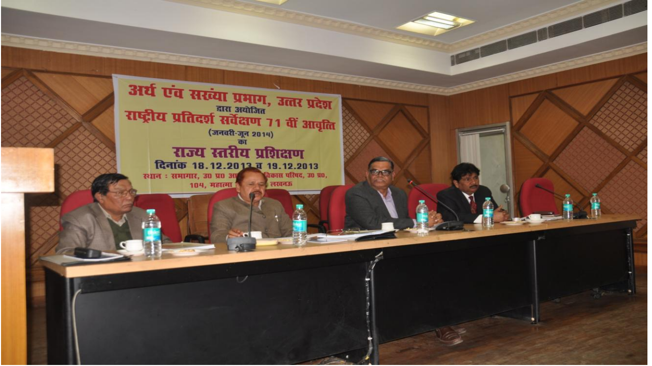
State Level Training for 71 st round of NSS on 18 -19.12.13 at Lucknow