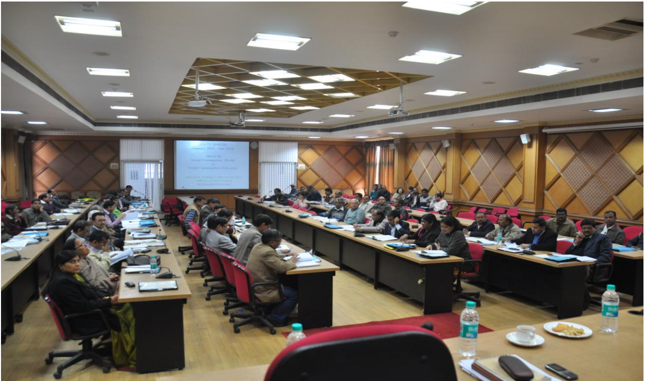
Participants of NSS 71 st round State Level Training Program