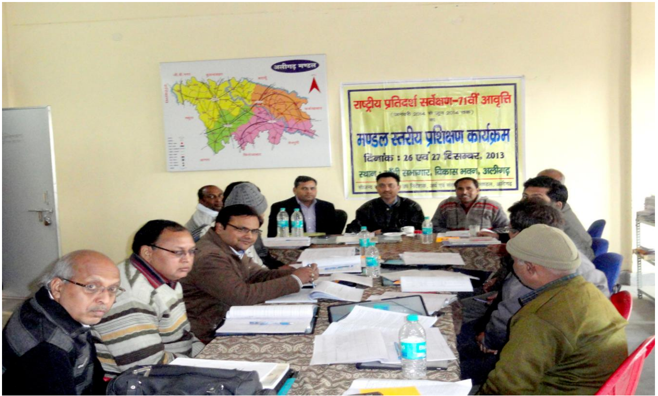
Training program of NSS 71 st round at Aligarh Division on 26-27.12.13