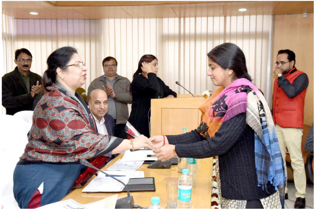
दिनांक 08.12.2017 को प्रभाग पर राष्ट्रीय सांख्यिकीय आयोग की 98वीं बैठक का आयोजन